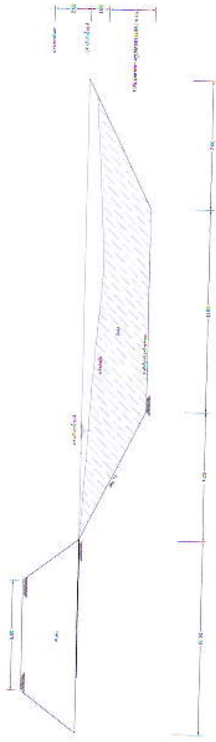
รูปตัดหน้าตัดโยธา ขนาด 1:200